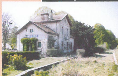
L'ancienne gare de Mandres