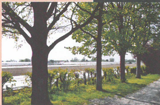
Le domaine de St-Leu

De nombreuses possibilités existent pour raccourcir le circuit et vous pourrez toujours revenir pour la suite une autre fois. Partez bien chaussé et emmenez de quoi boire et grignoter. Respectez la nature et les cultures et tenez vos animaux en laisse.